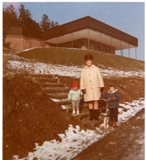
Bild: Winter 1969/1970

Der Geräteraum wurde vom Turnverein Petersberg hauptsächlich im Rahmen des jährlich stattfindenden Rauschenbergturnfestes genutzt.